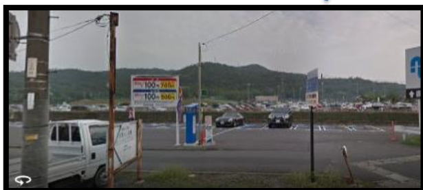
病院前のコインパーキング (約20台駐車可能)