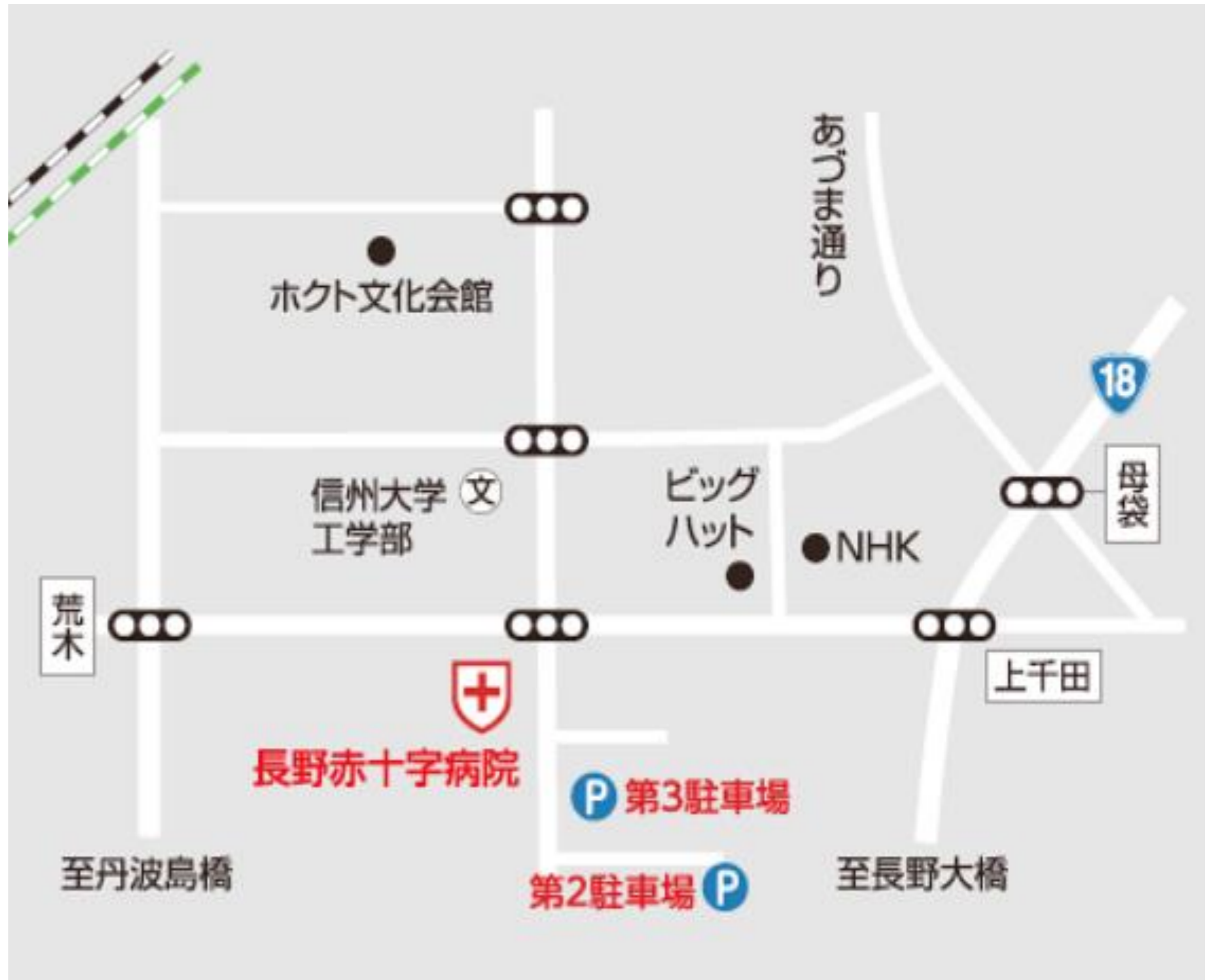
● 路線図 Route Map